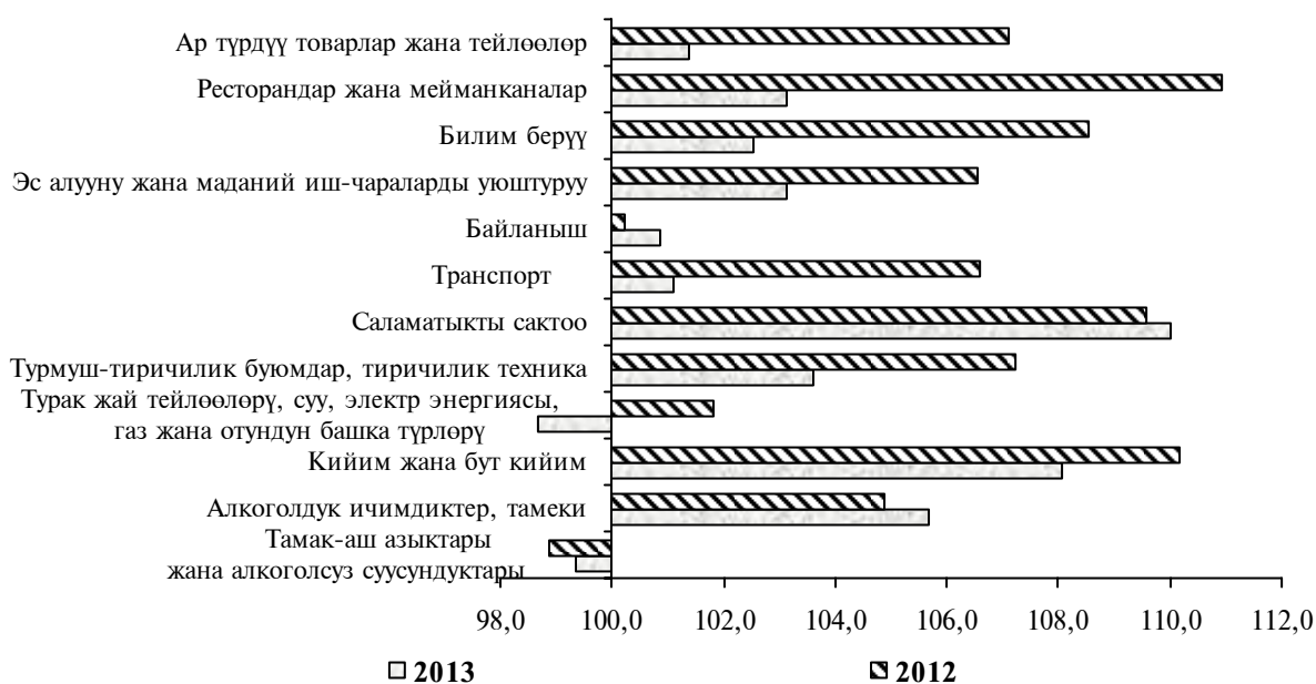
2-график: Январь-сентябрындагы негизги топтор боюнча товарлардын жана тейлөөлөрдүн керектөө бааларынын индекстери (пайыз менен)

Үстүбүздөгү жылдын январь-сентябрында азык-түлүк эмес товарлардай эле калкка көрсөтүлгөн тейлөөлөрдүн тарифтери дайыма көтөрүлүп 2012-ж. декабрынын деңгээлинен 2,6 пайызга ашты. Муну менен ү.ж. I кварталында негизги өсүш (1,3 пайызга) тейлөө тарифтерине байкалган, ал эми II жана III кварталдарында, турушуна жараша, 0,5 жана 0,8 пайызды түздү.