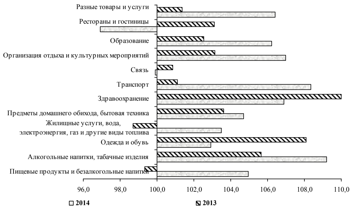
График 2: Индексы потребительских цен и тарифов на товары и услуги по основным группам в январе-сентябре (в процентах)

С начала т.г. прирост тарифов на услуги, оказываемые населению, в целом составил 4,2 процента. При этом, в III квартале т.г. прирост их составил 2,2 процента. Значительное повышение тарифов с начала т.г. зафиксировано на услуги технического обслуживания и ремонта личных транспортных средств - на 47,7 процента, воздушного пассажирского транспорта - более чем на треть, по пошиву одежды - на 15,5 процента, железнодорожного пассажирского транспорта - на 14,6 процента и по ремонту обуви - на 10,8 процента.